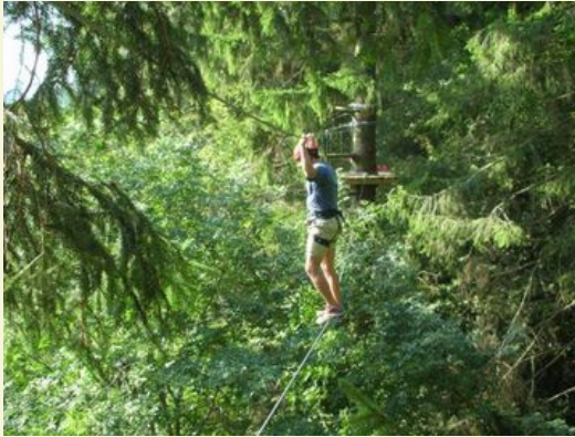
Parco Avventura Val di Vara